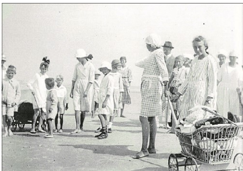
Sommerstemning. Udateret i bogen, men sandsynligvis omkring 1920.