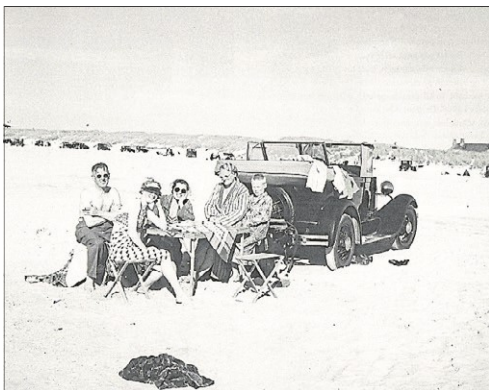
I slutningen af 1930-erne havde Løkken og Blokhus udviklet en masseturisme i de to kystbyer .