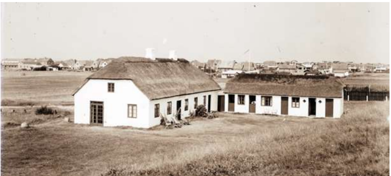
Sommerboligen Møllehuset, Holstvej 24, Blokhus