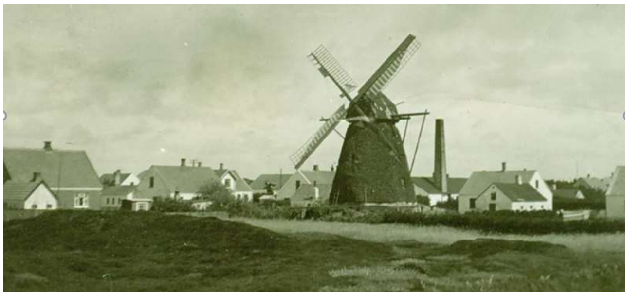
Hune Mølle inden den blev nedrevet i 1946

Da kom der endelig i sidste øjeblik den friske luftning fra vest, som man havde ventet med længsel, og møllen kørte rundt på sin bakke øst for byen dag og nat og fik julekornet besørget. Moderne mennesker, som er fortrolige med elektricitetens af vind og vejr uafhængige kræfter, forstår næppe, hvilket problem det var for de gamle, når den friske blæst nægtede dem sin bistand til julekornets formaling. Det var en nødvendighed, om der skulle holdes en sømmelig og reglementeret jul, som skik og brug havde været gennem tiderne."