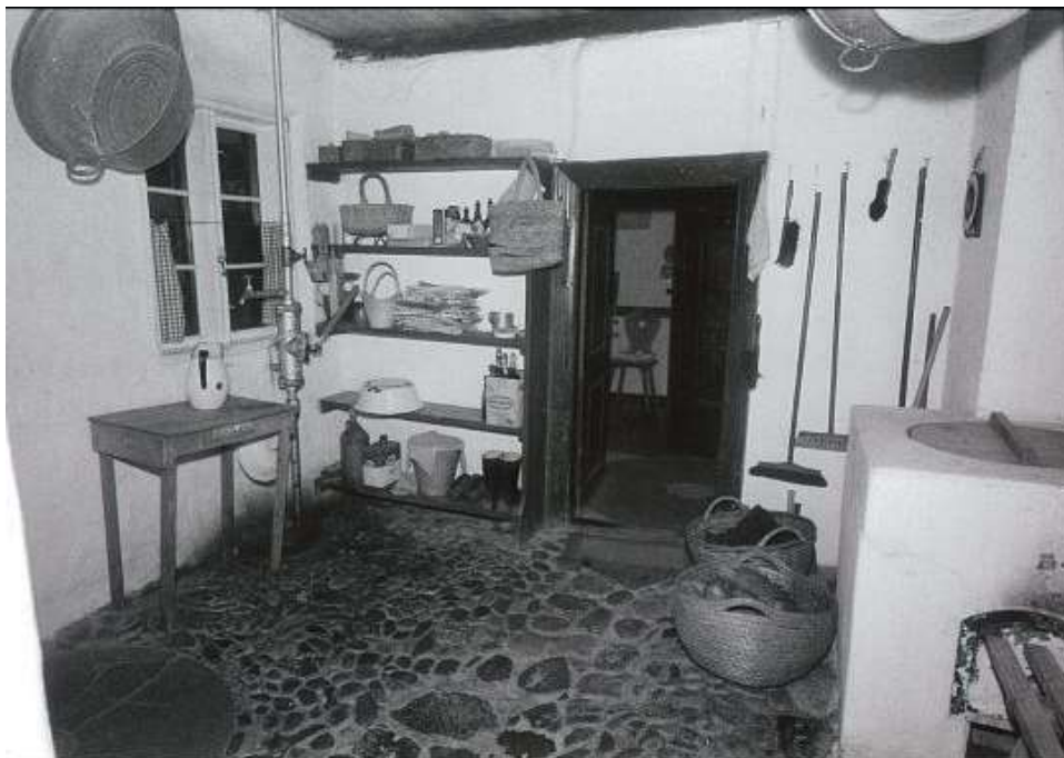
Bryggers og køkken med møllesten i gulvet 1958. Vandpumpe tv. og gruekedel th.