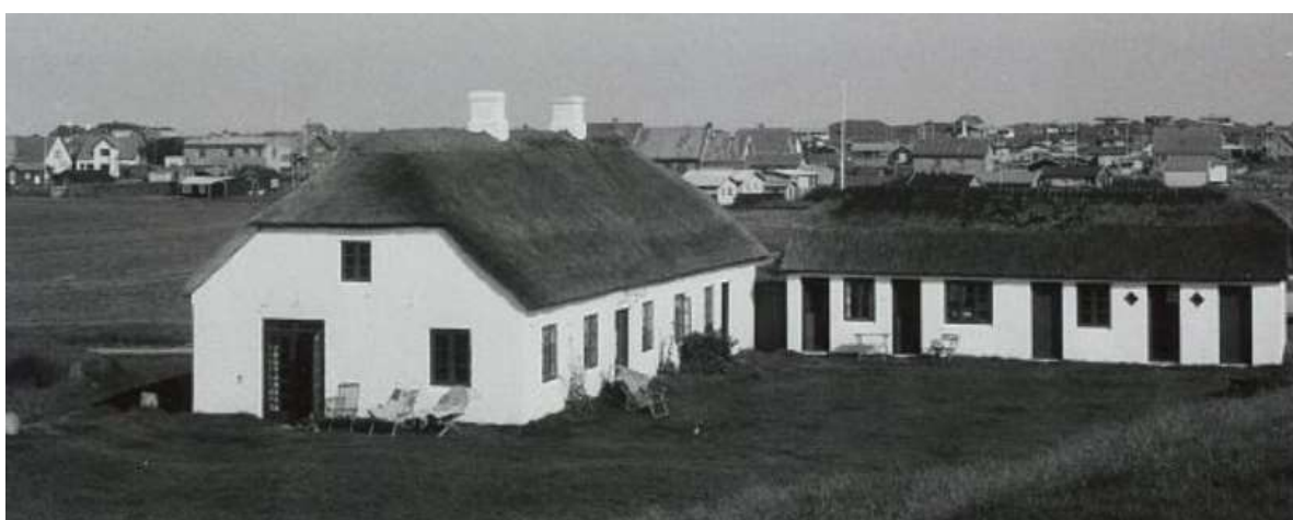
Udsigt fra Møllebakken mod Blokhus by 1958