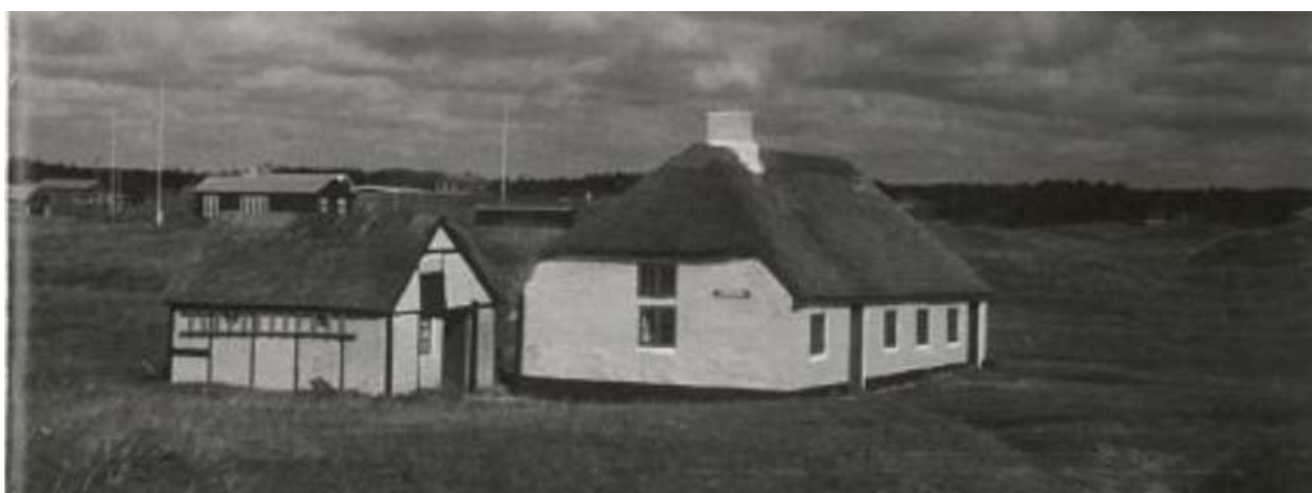
Blokhus' ældste hus, Færren, i 1942. Ejendommen for længst nedrevet