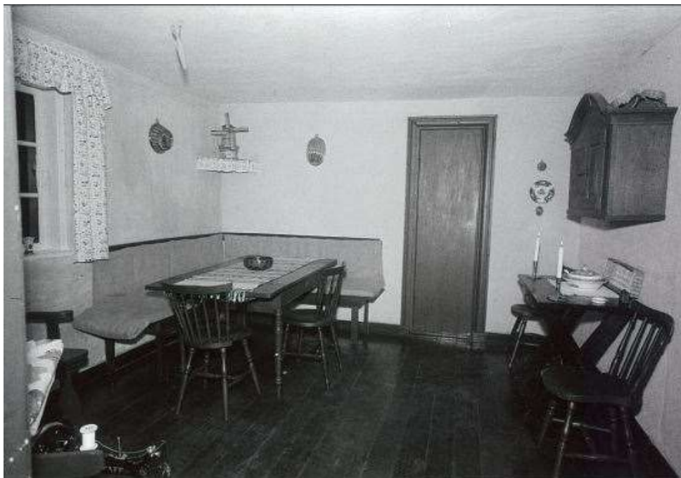
Spisestuen med møllen på hjørnehylden i 1958

Vi fik aldrig lov at glemme, at det var et møllehus vi boede i, fordi der i spisestuen stod en model af en mølle. For bordenden ved møllen sad vores morfar, som lige akkurat med spidsen af sin langemand kunne nå møllens vinge. Når vi børnebørn havde siddet pænt og spist op, fik møllen lov at dreje tre gange. Men ofte måtte vi nøjes med én eller to gange, når fætrene var med!”