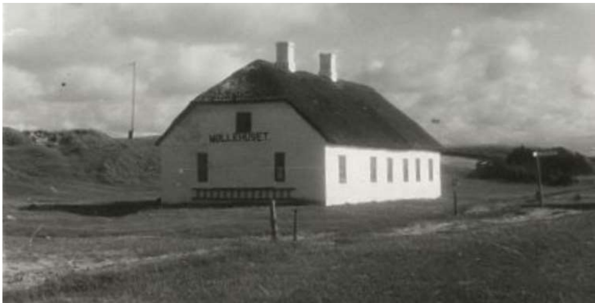
Møllehuset set fra nordvest i 1942, hvor stalden er nedrevet