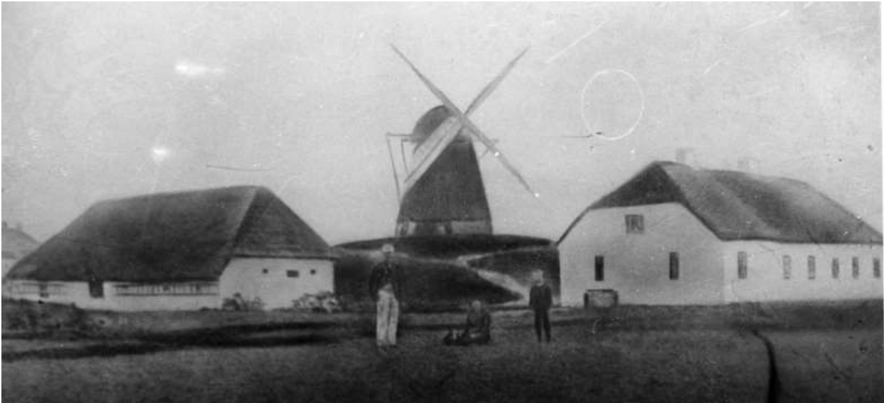
Blokhus Mølle og Møllehusene i 1880'erne