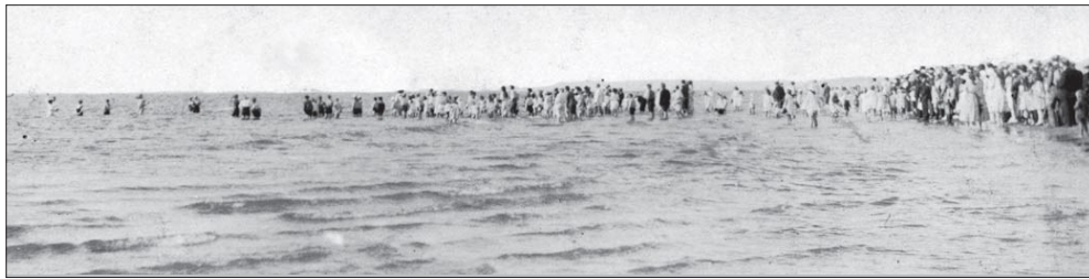
Omslagsbilledet til bogen om "Den store vækkelse" i Nordjylland viser en massedåb i Vesterhavet ud for Løkken i 1920'erne.