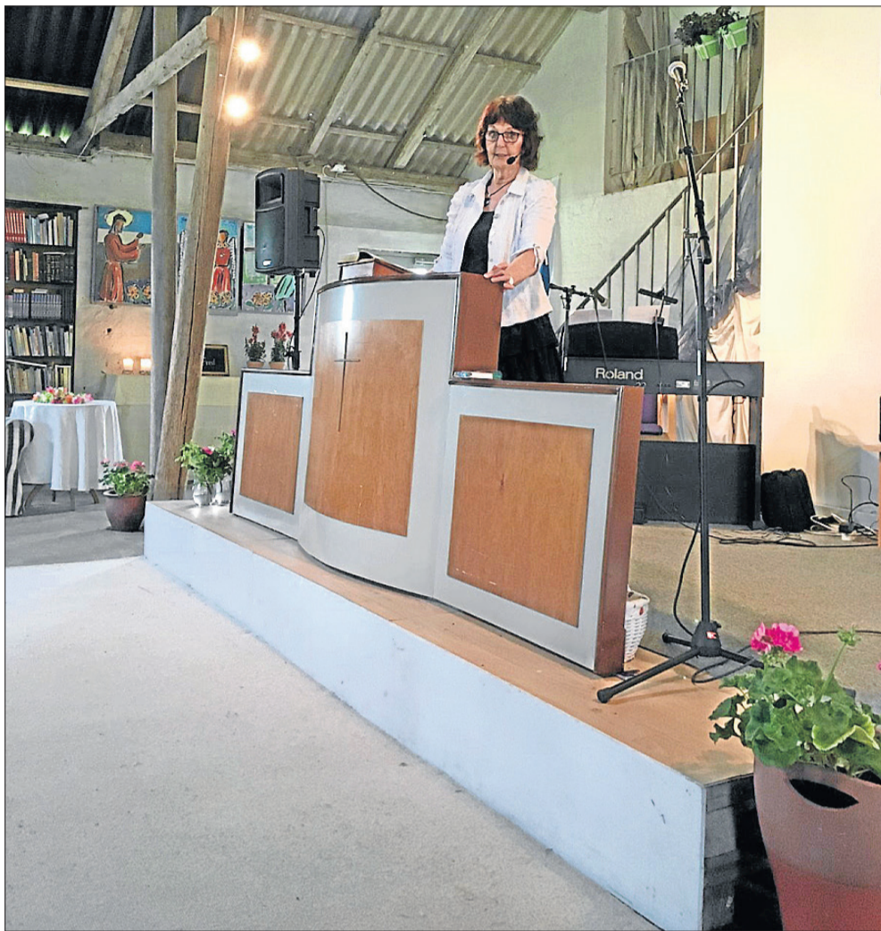
I årene 1980-2001 blev der afholdt bibelcamping, i folkekirkelig karismatisk regi Aalborg, hvor også folk fra Jammerbugt Kommune deltog.

vækkelse, som fejede hen over de etablerede kirkesamfund fra midt i 1950'erne og op gennem de næste årtier. Det var en ånds-udgydelse, som man tidligere kun oplevede i pinsekirkerne og Apostolsk Kirke, som nu også gik på tværs af kirkesamfundene.