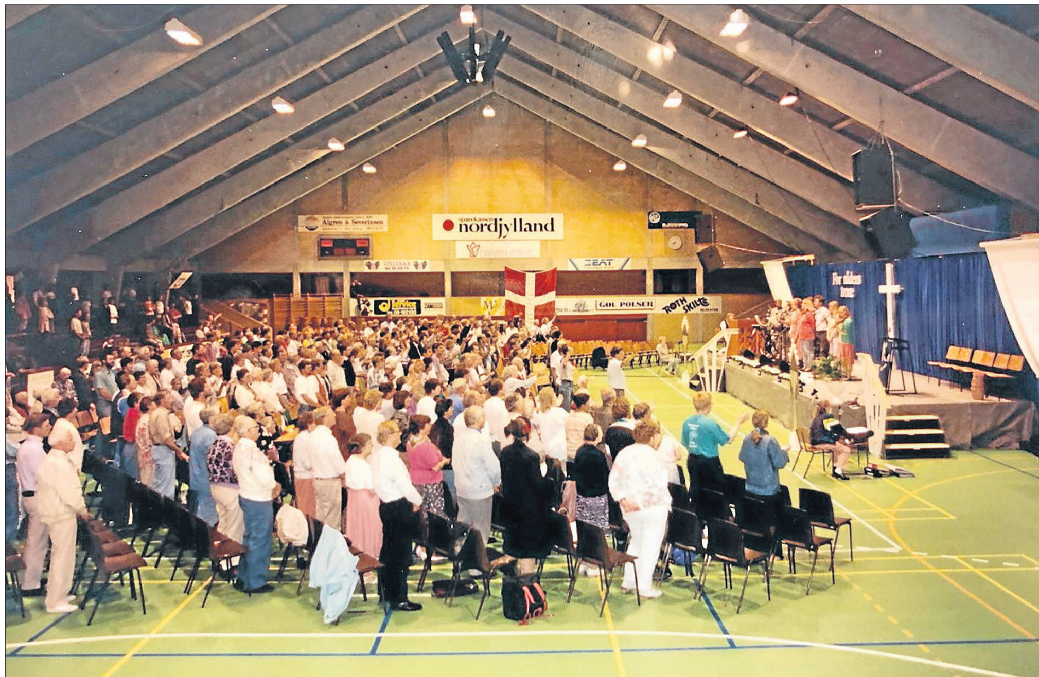
Peters Kirken i Kaas er ombygget til bolig, og prædikestolen er erhvervet af Vester Kringel i Ingstrup, hvor der afholdes karismatiske møder.