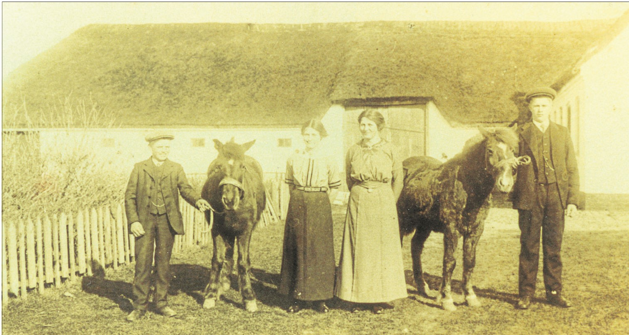
Dyrenskolen, Søkkærvej 75 på Rendbæk, bygget som baptistskole og mødesal i 1879.

En stor del af Aalborg Baptistmenigheds medlemmer boede i Vendsyssel. Efter Føltveds død i 1856 blev den store Aalborg-menighed med 500 medlemmer opdelt i tre menigheder. Jetsmark Baptistmenighed, der havde Vestvendsyssel og Thyland