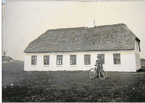
Baptisternes skole- og mødesal på Melkær ved Tranum, bygget 1892