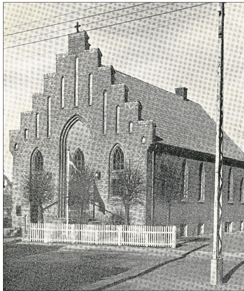
Pandrup Baptistkirke.