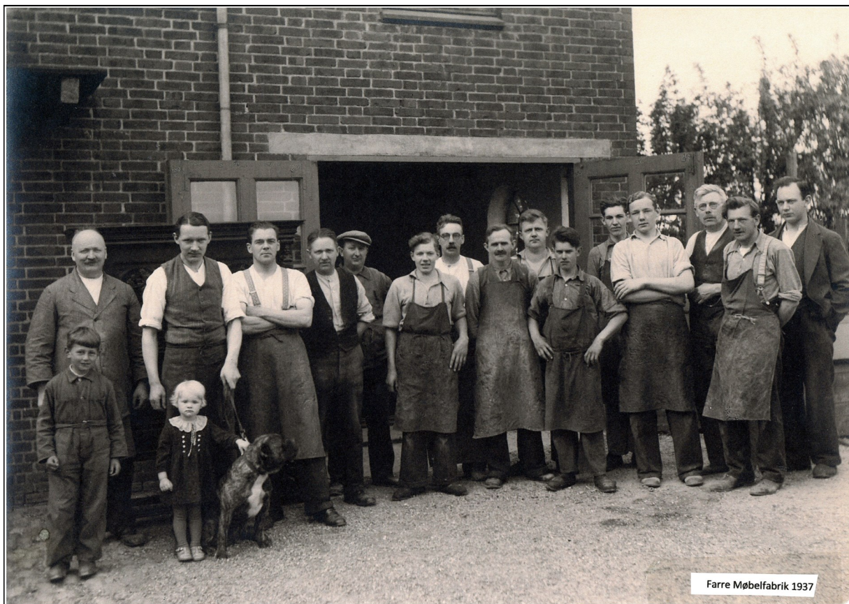
Farre Møbelfabrik 1937.