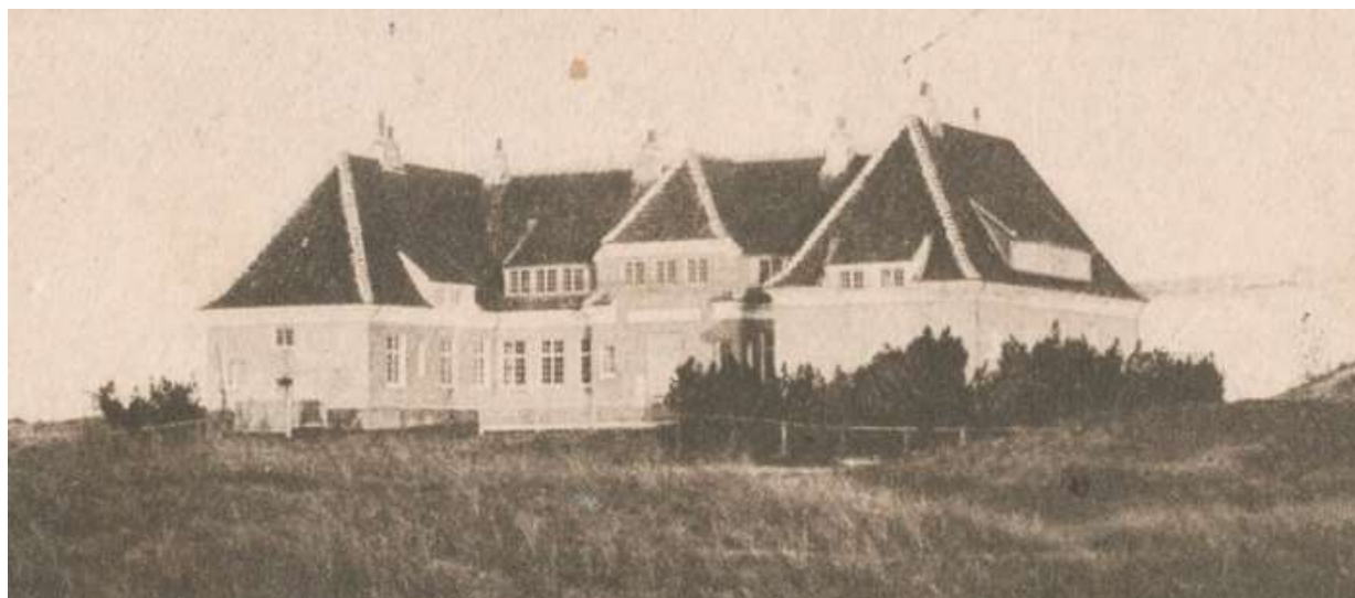
Kongevillaen Klitgården ved Skagen 1926

Kongen besluttede at afslutte sommerens ophold på Klitgården ved Skagen den 19. september, og det blev nu Dannebrog's opgave at sejle den kongelige familie til København. Kongen skulle i øvrigt holde statsråd den 20. september om formiddagen.