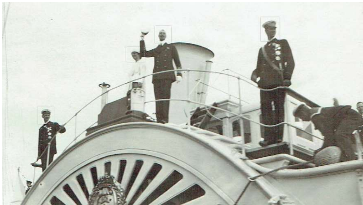
Fra venstre prins Knud, dronning Alexandrine, kong Christian 10 og kronprins Frederik på Dannebrog 1920

De, der efter frokost den 20. september 1919 tog sig en spadseretur på Langelinie i København, så ved 13-tiden kongeskibet Dannebrog stå havnen ind. Det var vel at mærke det gamle kongeskib, der blev drevet frem af 2 store skovlhjul, et på hver side af skibet. Fra masten vajede kongestanderen, majestæterne var altså ombord. Kong Christian X. og dronning Alexandrine havde tillige deres yngste søn, prins Knud med ombord.