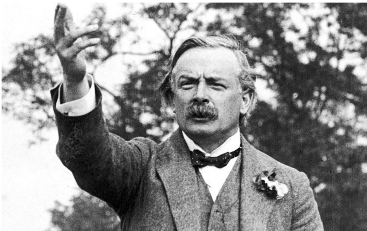
David Lloyd George var premierminister i Storbritannien fra 1916 til 22. Han voksede op i en baptistfamilie i Wales, virkede som lægprædikant og uddannede sig til advokat.

Lloyd George, Englands førsteminister, begyndte som lægprædikant, han kastede sig ind i politik for at afværge, at den engelske kirke blev opslugt af katolicismen. Man kalder ham i England for "den lille dynamo". Hans kraft er stor, og ligesom dynamoen får han styrken andetsteds fra, ikke fra sig selv, men fra Gud.