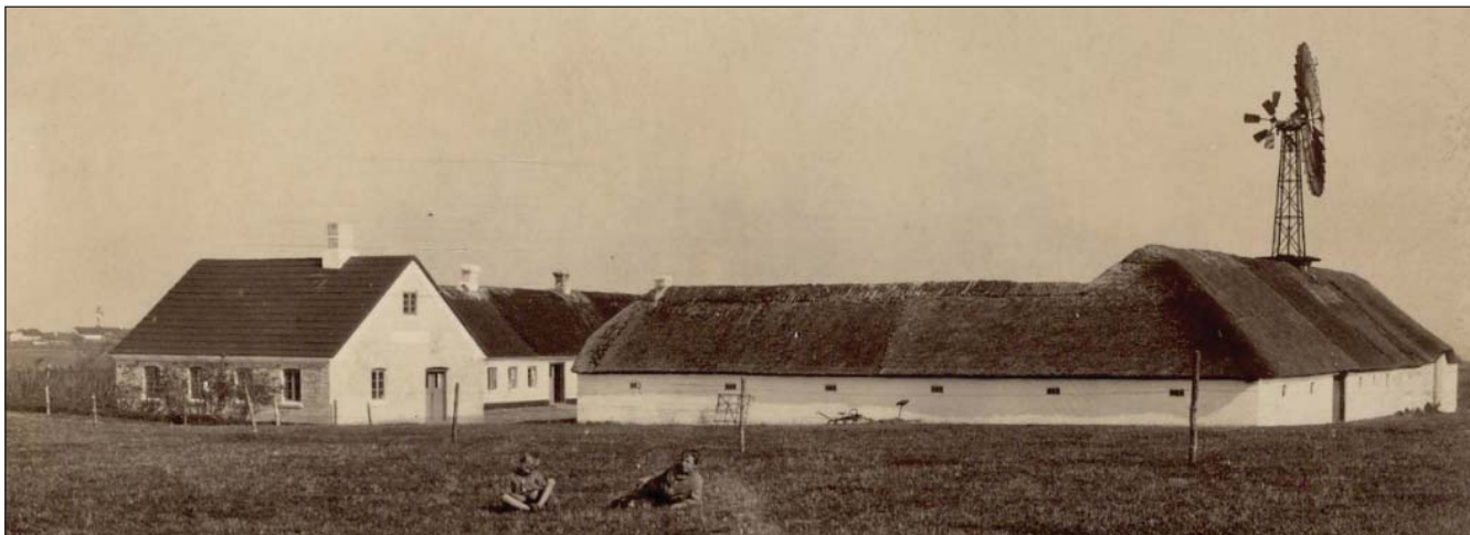
Mellemgård med baptisternes forsamlingshus til venstre omkring år 1900.