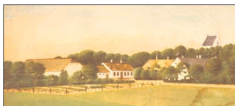
Saltum Kirke og Præstegaard, hvor Herrnhuterne samledes i 1700-1800-tallet.

Kristi Menighed: Den amerikanske brødre-menighed, Schwarzenau Brethren, som i dag kaldes Kristi Menighed, blev stiftet af