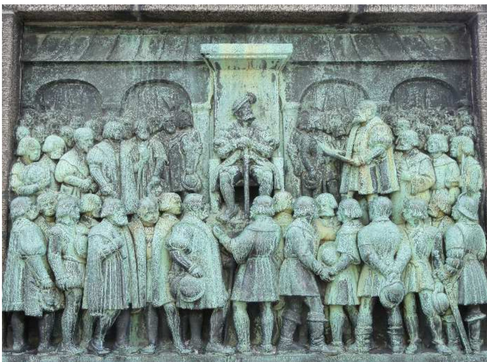
Kong Christian den Tredje på Herredagen den 30. oktober 1536 i København sammen med de mænd, blandt andet Peder Thomesen, der vedtog reformationens indførelse

Kort tid efter døde kong Frederik og blev efterfulgt af Christian den tredje, der sendte ordre til den overmodige Viborg-bisp om, at han skulle give de fattige præster deres jord tilbage. Kongen var lutheraner og var ikke bange for at vise det. I 1536 sendte han en opfordring til borgerne i Viborg om at gribe bispen og føre ham til København. Det var noget, de brave folk ikke lod sig sige to gange. Samme efterår blev han afsat sammen med de andre katolske biskopper.