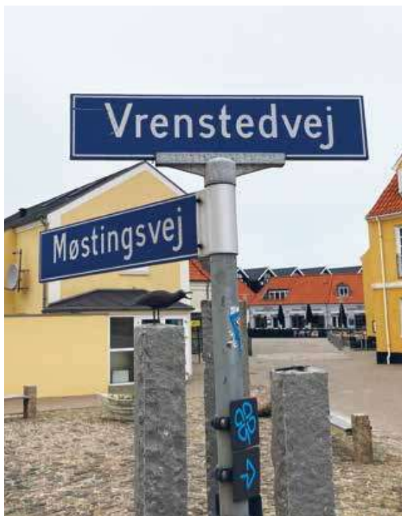
Et par af kommunens nye gadeskilte på Vrenstedvej og Møstingsvej i Løkken.

bage for at forhøre hos Peer og Poul, hvor den og den bor? Selv for Postbudene, der ere kjendte (naar et nyt Postbud en Gang i mellem bliver ansat, er han endnu uheldigere stillet), har det ofte sin Vanskelighed at finde Adressaten til et Brev". Nogle synes altså, at det var på tide, at byen fik gadeskilte og husnumre.