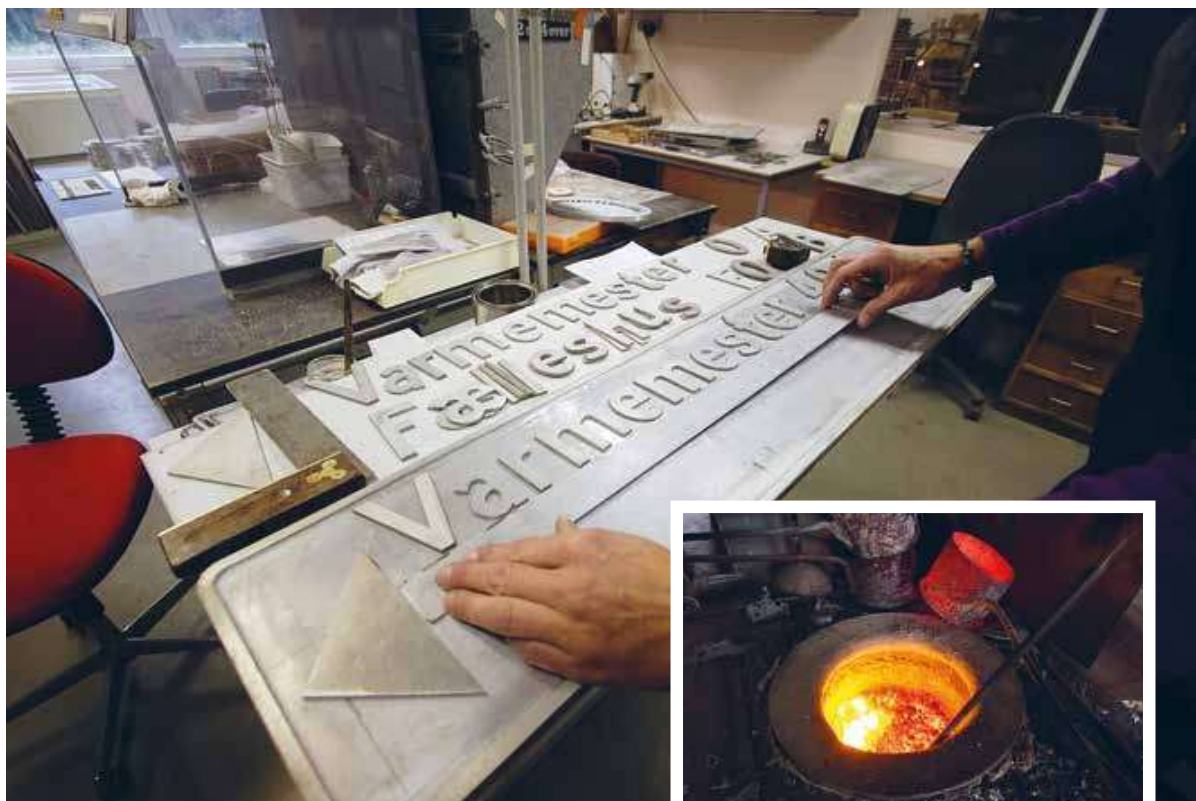
Sætteriet hvor de mange forme til de støbte aluminiumsskilte bliver skabt.