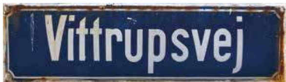
Det gamle emaljerede gadeskilt på hjørnet af Søndergade og Vittrupsvej i Løkken.