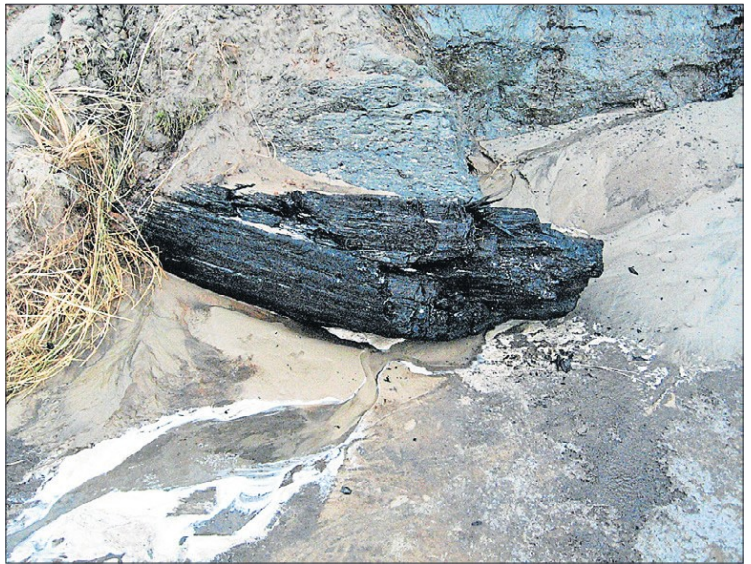
Det gamle egetræ i 2016 inden tyveri af træet begyndte