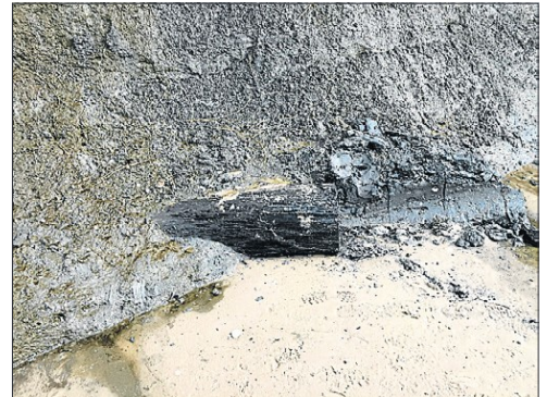
Træet efter tyveriet i marts 2017.

De fleste kender sommervillaen Blånas, som ligger på klinten ved Furreby Bæk. 'Den blå Næse' ligger læn-