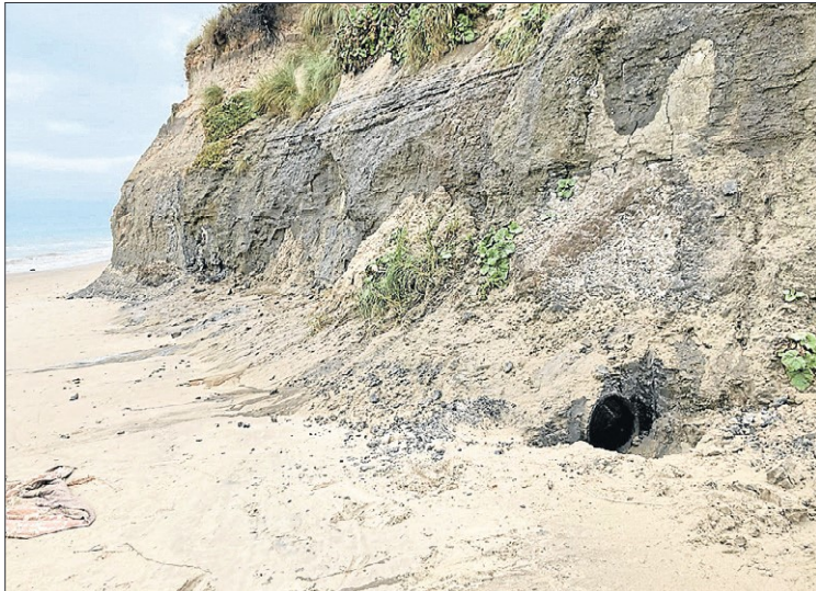
Den Blå Næse i Furreby gemmer på en moseeg (nederst).

- Der er tydeligt, at tyveriet vækker harme og opsigt blandt folk, for der kom en del reaktioner på opslaget, fortæller han.