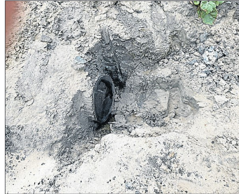
Der er desværre savet et stykke af den gamle moseeg.