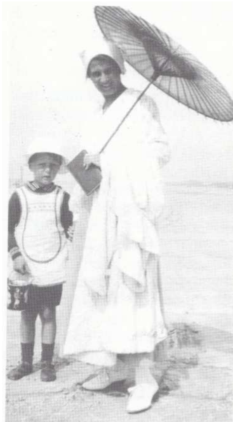
Badegæster på Grønhøj strand 1917