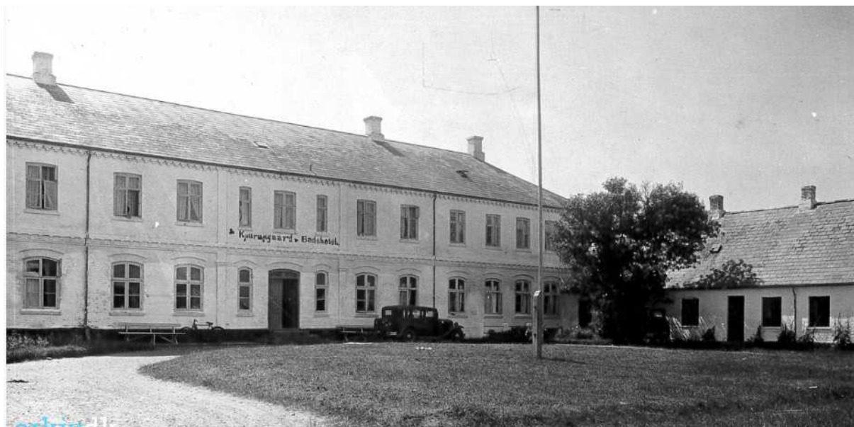
Vesterhavsbadet Kjettrupgaard 1910