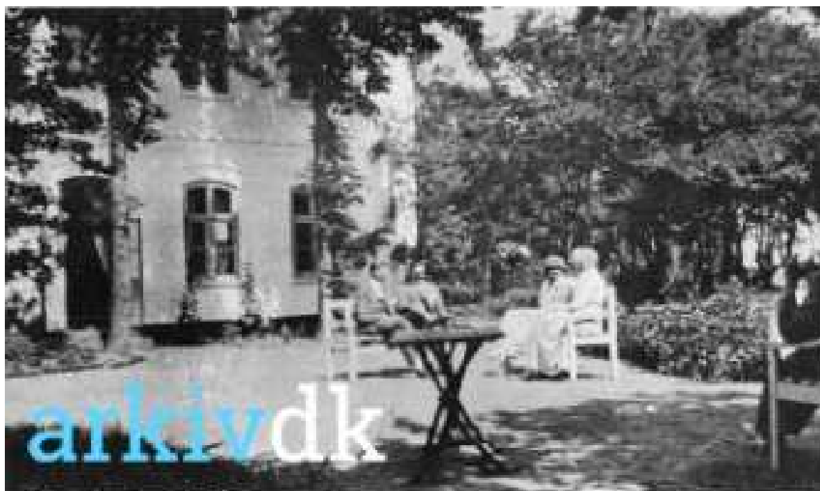
Vesterhavsbadet Kjettrupgaard 1910