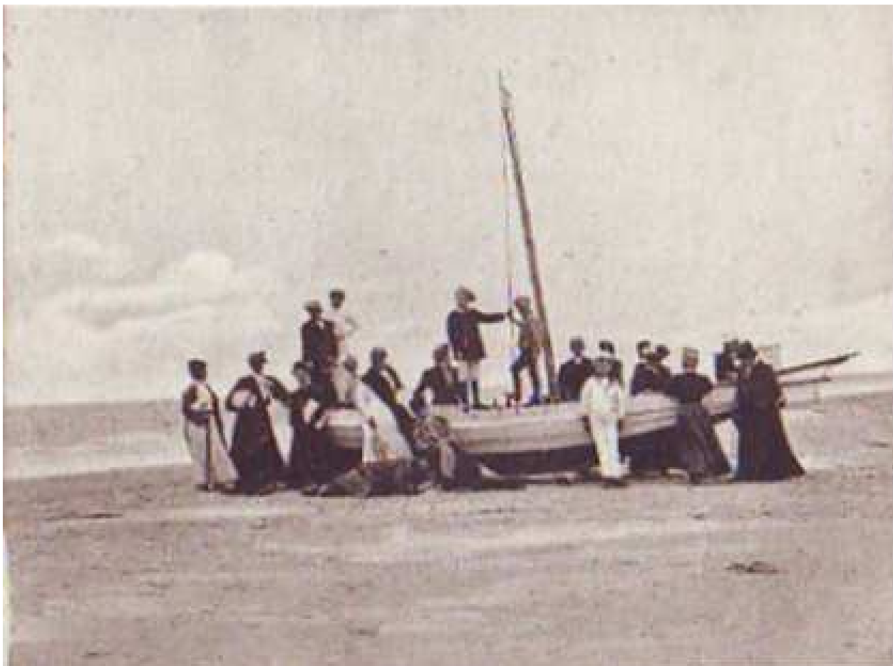
Badegæster fra Kjettrupgaard på Grønhøj strand omkring 1910