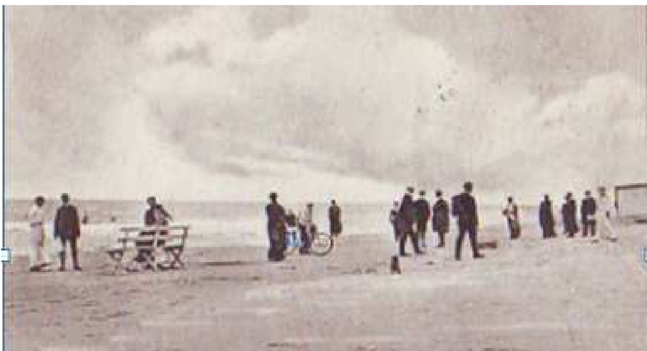
Badegæster fra Kjettrupgaard på Grønhøj strand omkring 1910

Der blev ikke kun holdt fast i de sociale skel ved fordelingen af værelserne, det spillede også ind ved placeringen ved spisebordet eller -bordene. Der var en sikker fornemmelse for rang, når gæsterne placeredes. Fornemmeste plads var nærmest vært eller værtinde. Se blot billedet med fru Keller for bordenden og gæsterne på Kettrupgård. Man blandede sig ikke med lokalbefolkningen og havde ikke meget tilfælles med dem. Slet ikke med hensyn til at gå på stranden for sin fornøjelses skyld eller at dyrke badelivet. Som fiskerne sagde: "I vandet kan man tidsnok komme!"