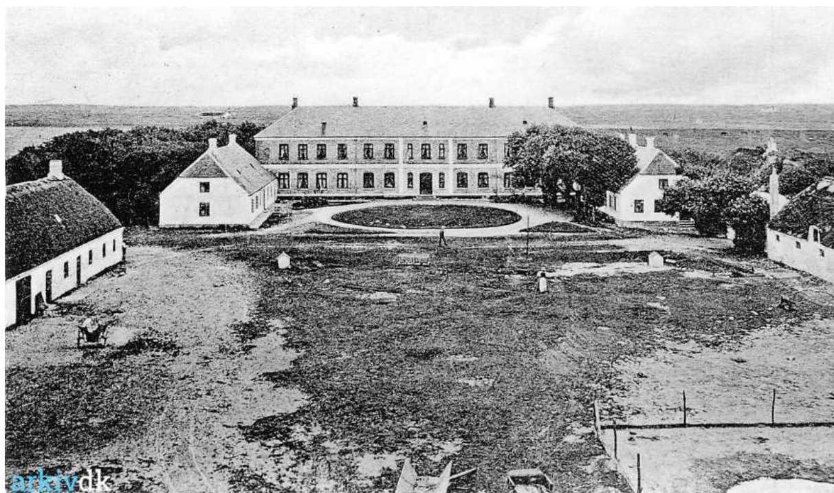
Vesterhavsbadet Kjettrupgaard 1910

I begyndelsen af 1900-tallet var det en livsstil for det bedre borgerskab at tilbringe sommeren på et badehotel. Badehotellerne havde et eksklusivt præg, hvor kun fine, velhavende familier ferierede. Inventaret på værelserne var dog meget enkelt: seng, kommode, et skab, en pindestol og et bord samt et servantestel, en natpotte og en spand til spildevand. Det var ikke så forskelligt fra soveværelsesmøblementet i et herskabshjem på den tid. Gæsterne var hovedsagelig stamgæster, der mere eller mindre kendte hinanden, og de tilhørte den samme kreds af blandt andet akademikere, tjenestemænd og kunstnere.