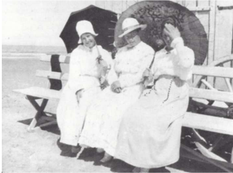
Tre damer fra Kjettrupgaard på Grønhøj strand omkring 1910-15