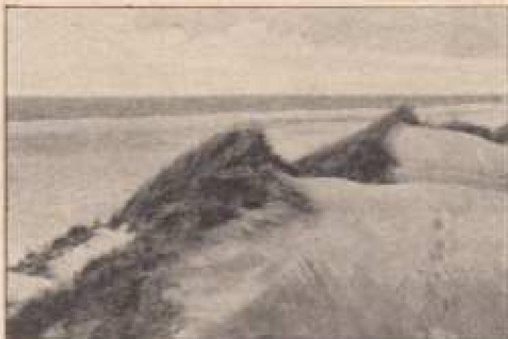
Klitparti ved Kjettrupgaard.

Vesterhavshadet »Kjettrupgaard» er beliggende mellem Blokhus og Løkken. 15 Min. Gang fra Havet og er bekendt for sin smukke Have og den smukke stenfri Strand, som er 250 Alen bred. Vandet er saa blankt som Solv og Badene aldeles farefri. Her findes pragtfulde Klitpartier, hvor man altid kan finde Læ for Vinden. Udflugter til Borglum Kloster og den store Vildmose, som mange Gange har været hærgnet af betydelige Ildbrænde.