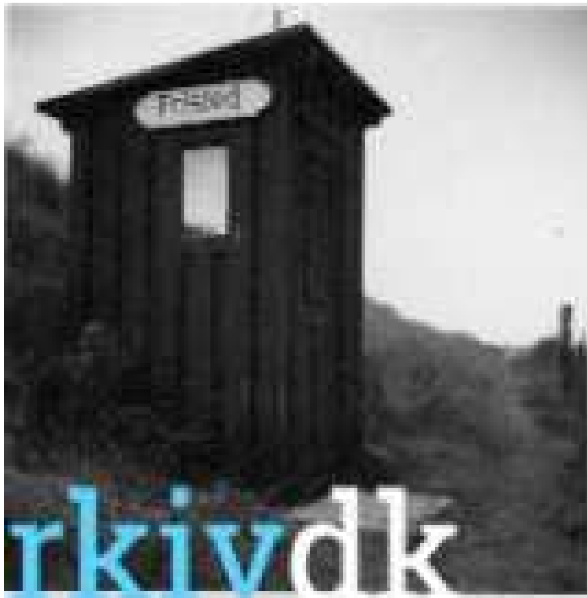
Staunings udendørstoilet Fristed

Fra den dag var Grønhøj, Kettrup Bjerge og statsministerens sommerhus kendt over hele landet, ja, endog uden for landets grænser. De danske aviser og endog engelske aviser omtalte statsministerens uheld i klitterne. Tidligere var der ro og fred i det idylliske Grønhøj, men nu kørte og gik badegæster og fastboende fra Løkken og Blokhus til statsministerens sommerbolig for at betragte stedet, hvor ulykken skete. En avis skrev: ”De daglige besøgende er så talrige, at det ganske givet må kunne betale sig for en driftig iskagesælger at etablere sig i nærheden af Hr. Staunings prunkløse hytte, han ville sikkert gøre store forretninger.”