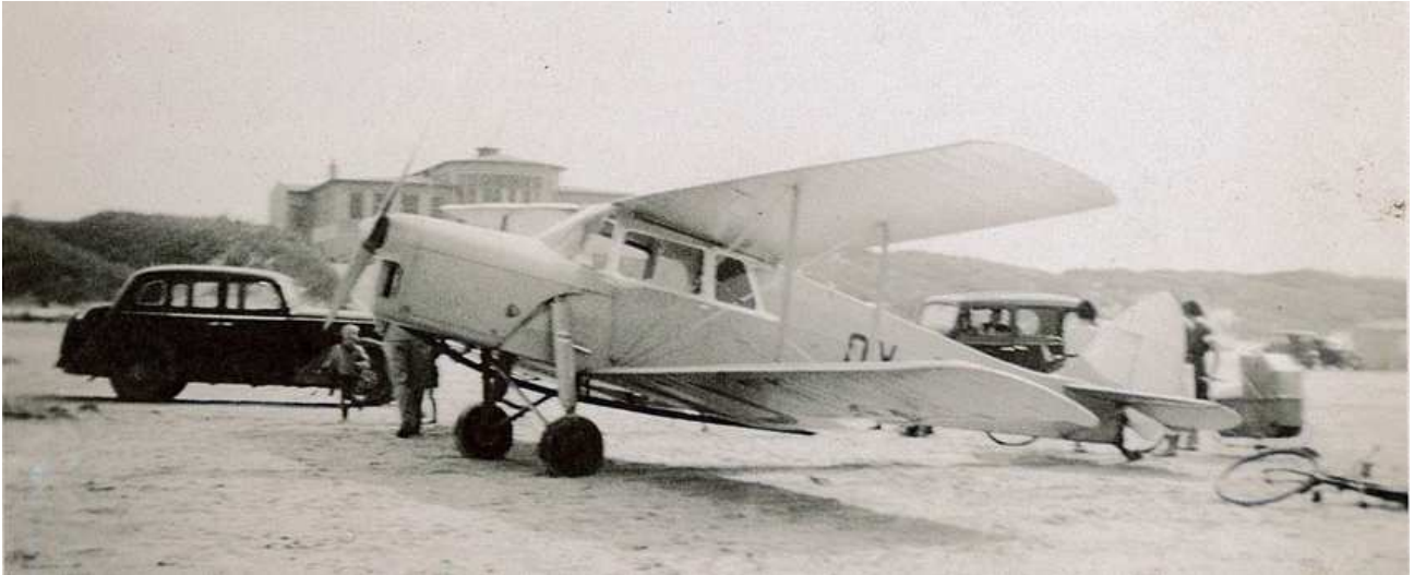
Et tovinget fly, som bragte dokumenter til Stauning, på Blokhus Strand 1939