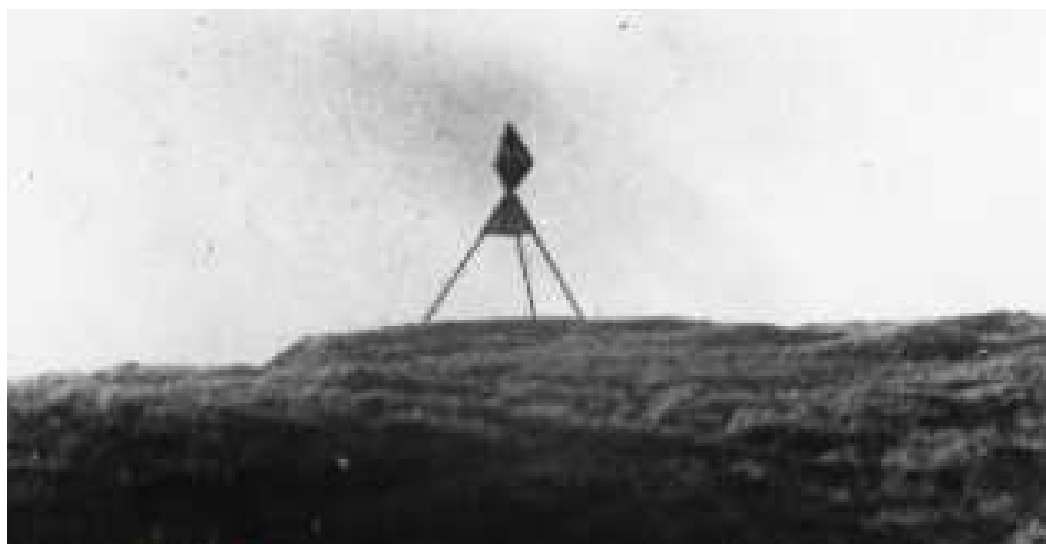
Sømærket Grønhøj i Kettrup Bjerge