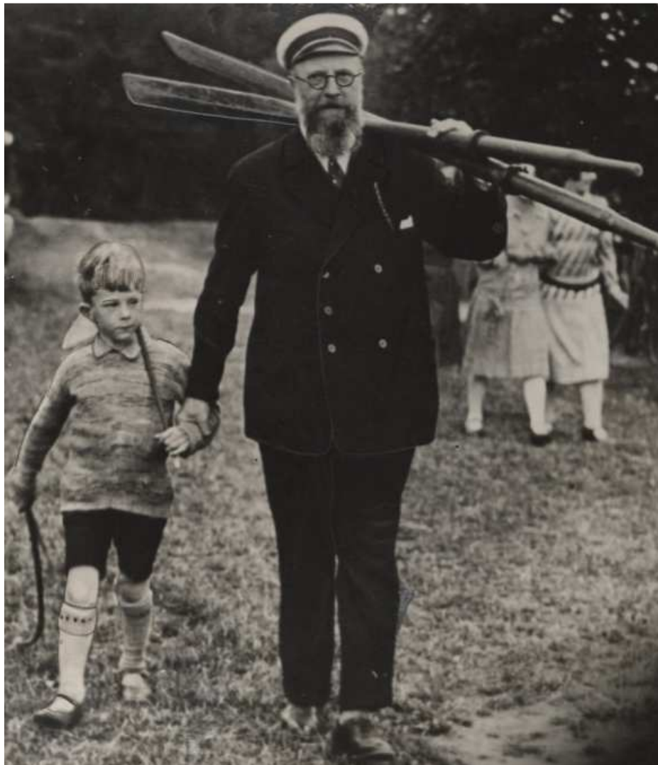
Thorvald Stauning i fritidsdress