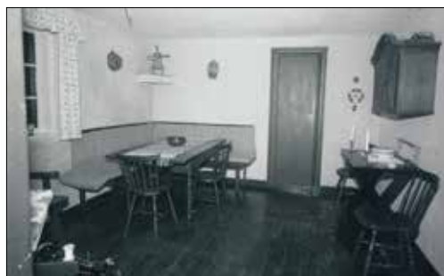
Spisestuen med møllen på hjørnehylden i 1958.

Vi fik aldrig lov at glemme, at det var et møllehus vi boede i, fordi der i spisestuen stod en model af en mølle. For bordenden ved møllen sad vores morfar, som lige akkurat med spidsen af sin langemand kunne nå møllens vinge. Når vi børnebørn havde siddet pænt og spist op, fik møllen lov at dreje tre gange. Men ofte måtte vi nøjes med én eller to gange, når fætrene var med!«