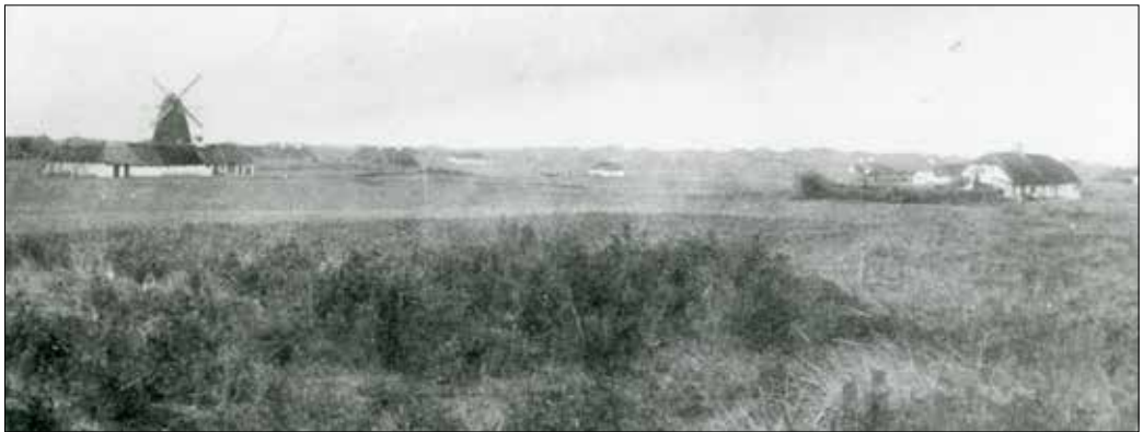
Blokhus Mølle, Møllehusene og en ejendom til højre omkring år 1900.

Staten eksproprierede en del ejendomme og jord, der lå øst og syd for Blokhus, til klitplantage i foråret 1895 - en del af arealet hørte ind under de fredede klitter. En af de berørte ejendomme var også Blokhus Mølle, hvor der blev opmålt godt 18 tønder land, som blev takseret til 800 kr.