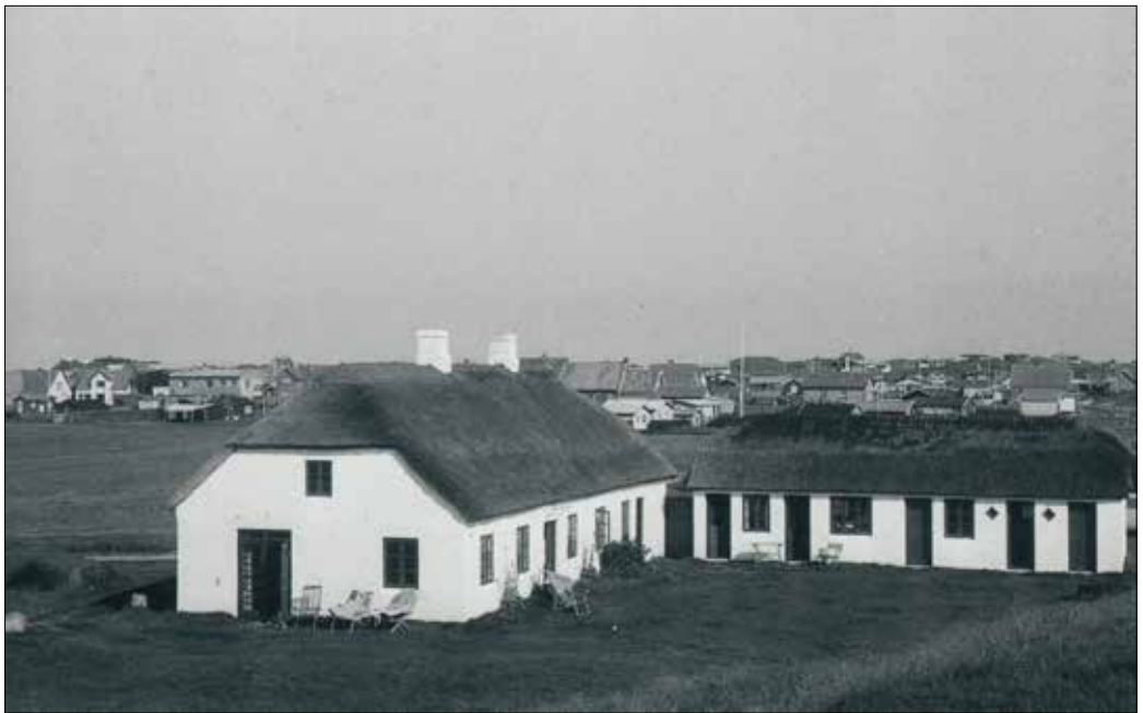
Udsigt fra Møllebakken mod Blokhushus by 1958. (Privatfoto)