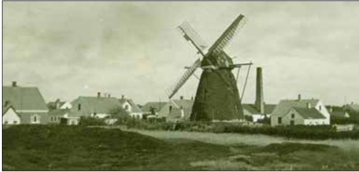
Hune Mølle inden den blev nedrevet i 1946.