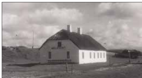
Møllehuset set fra nordvest i 1942, hvor stalden er nedrevet.