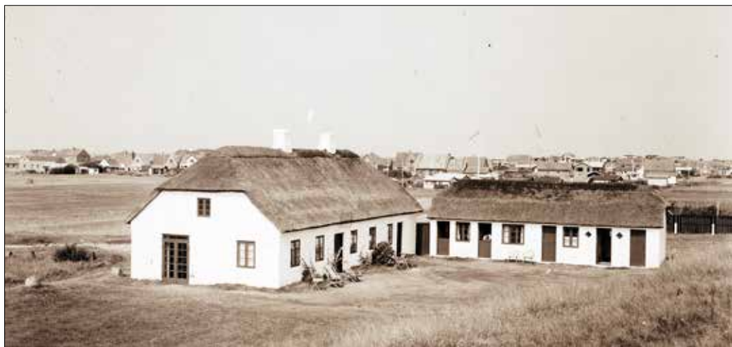
Sommerboligen Møllehuset, Holstvej 24, Blokhus. (Foto: Hans Pors Atelier i Silkeborg 1930'erne)