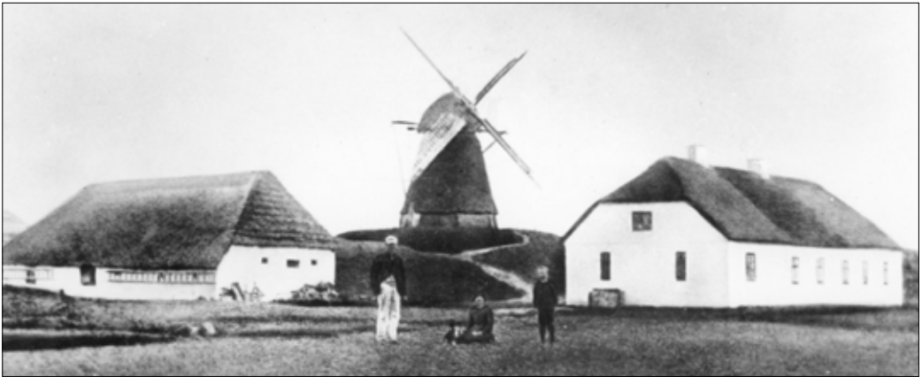
Blokhus Mølle og Møllehusene efter år 1900.