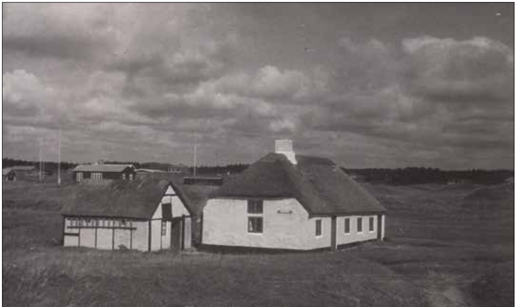
Blokhushus' ældste hus, Ferren i 1942. Ejendommen er for længst nedrevet.