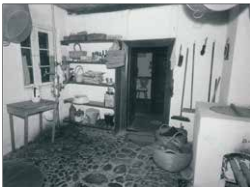
Bryggers og køkken med møllesten i gulvet 1958. Vandpumpe tv. og gruokedel th.