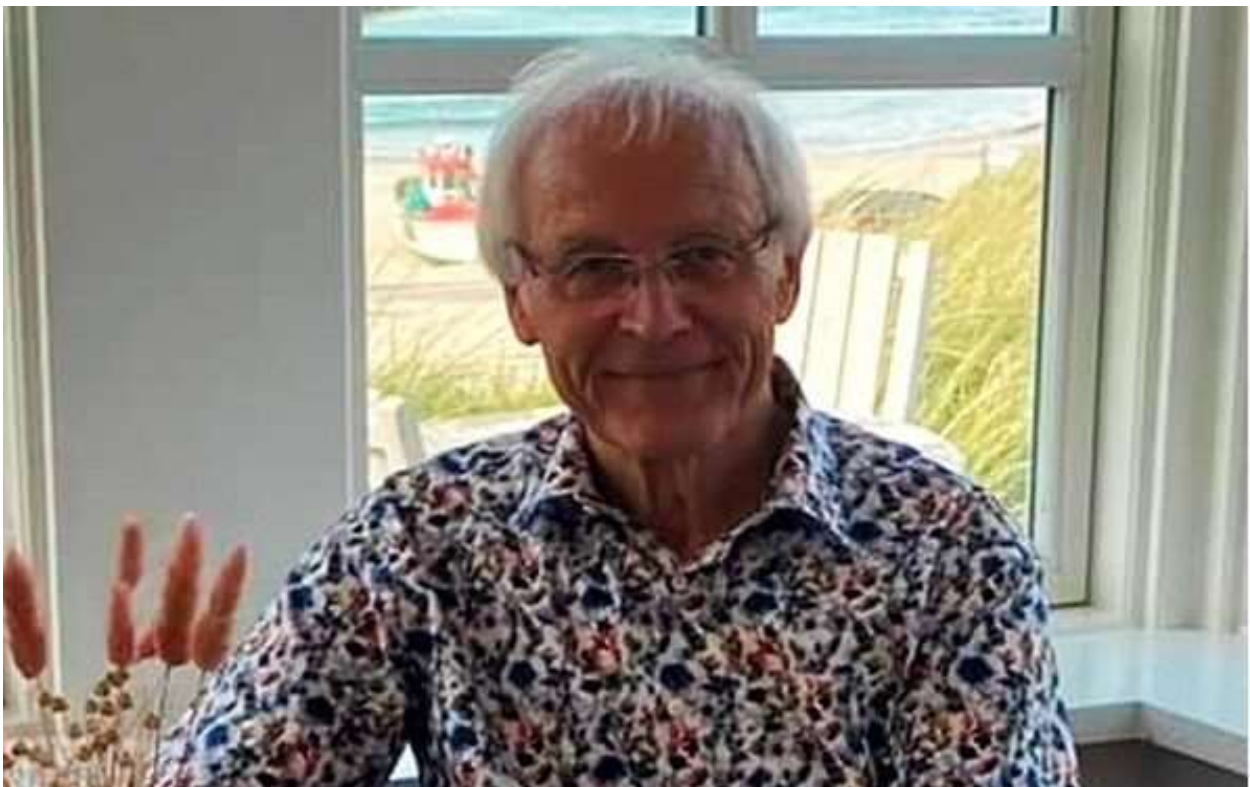
Forfatter Simon Jacobsen.